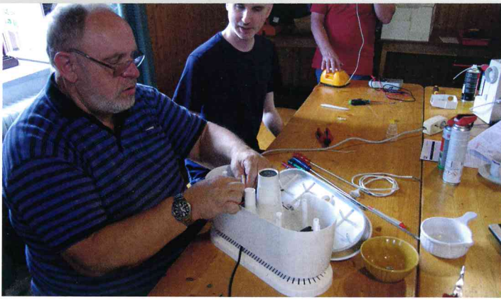
Eine Maschine zum Bügeln von Hemden wird begutachtet.