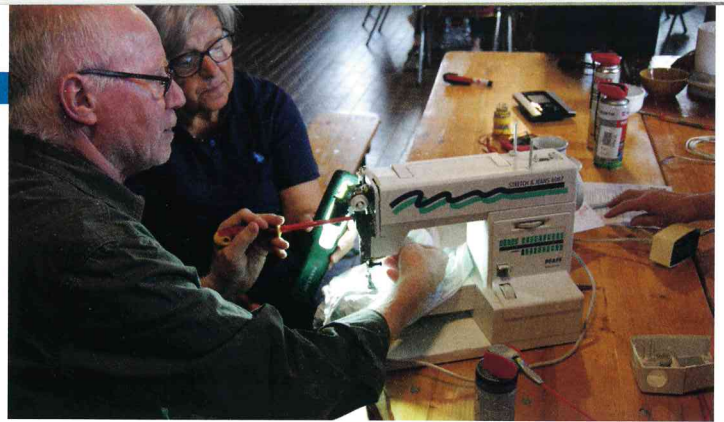
Viele der gebrachten Gegenstände sind Nähmaschinen.